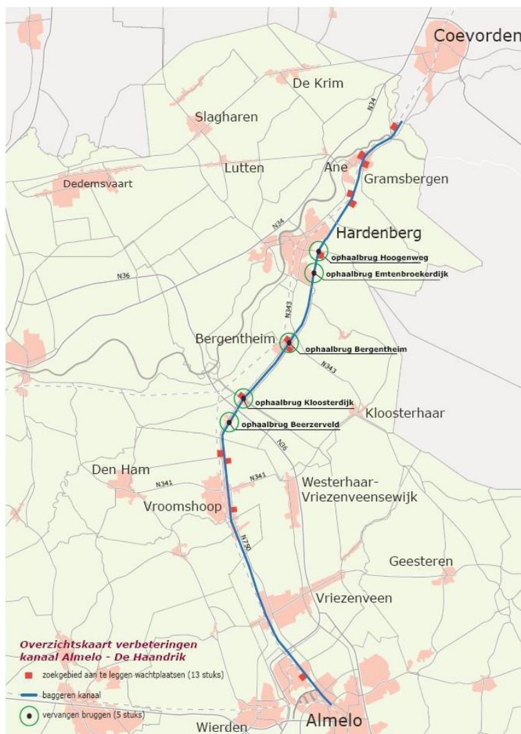
Figuur 2: Overzichtkaart gebied werkzaamheden Kanaal Almelo - De Haandrik